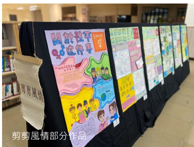
剪剪風情部分作品