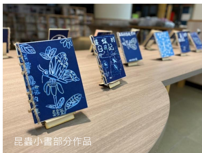
昆蟲小書部分作品